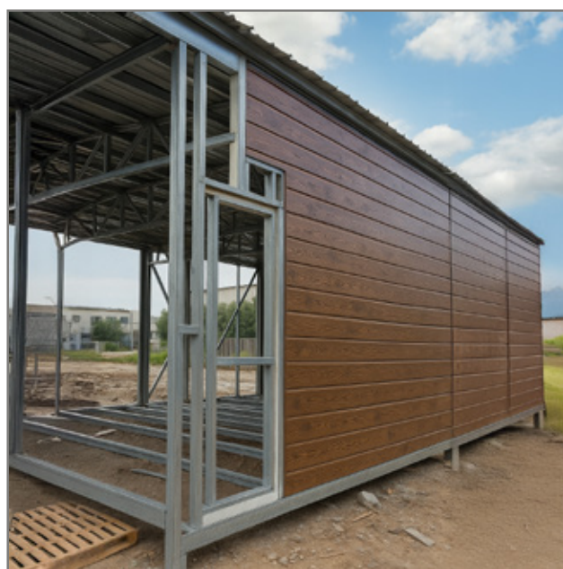
SOBRE ESTRUCTURAS METÁLICAS AUTOPORTANTES