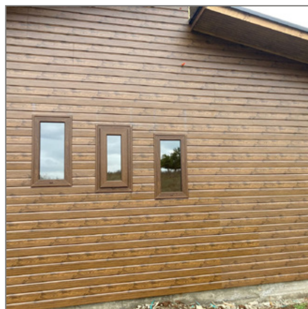
SOBRE MAMPOSTERÍA TRADICIONAL