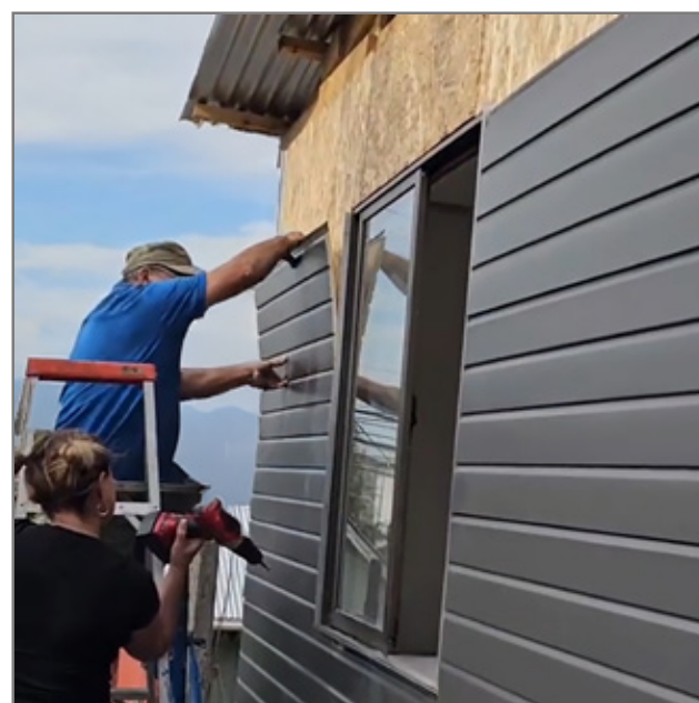
SOBRE ESTRUCTURA DE MADERA