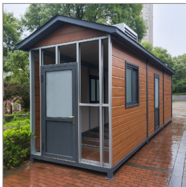
SOBRE ESTRUCTURA DE STEEL FRAME